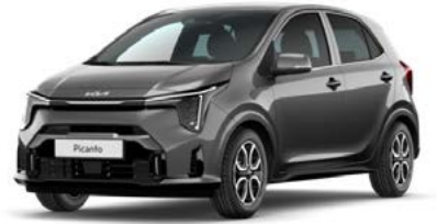
Astrograu Met. (M7G)