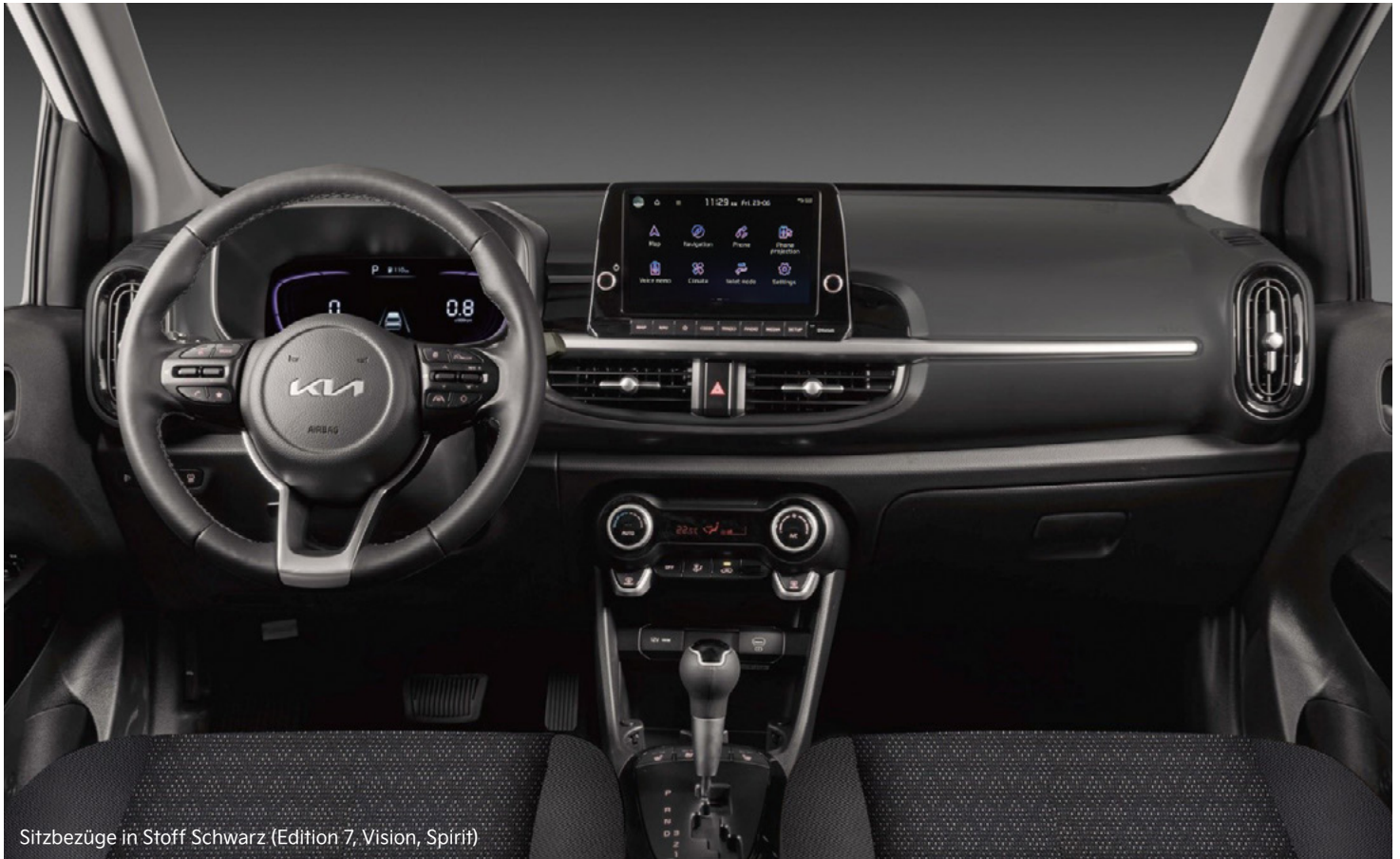
Sitzbezüge in Stoff Schwarz (Edition 7, Vision, Spirit)

Elegante, schwarze Stoffsitze oder Sitzbezüge in hochwertiger Ledernachbildung in Schwarz mit grauen Akzenten – im Innenraum des Kia Picanto fühlst du dich immer gut aufgehoben.