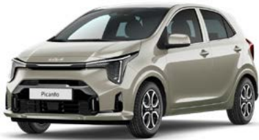
Milky Beige Met. (M9Y)