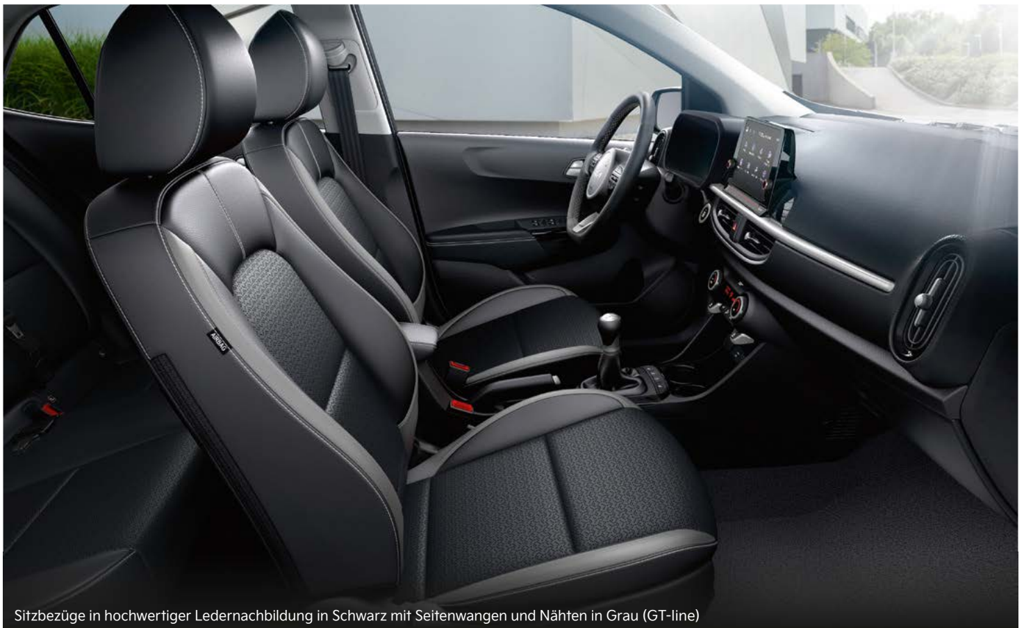
Sitzbezüge in hochwertiger Ledernachbildung in Schwarz mit Seitenwanen und Nähten in Grau (GT-line)