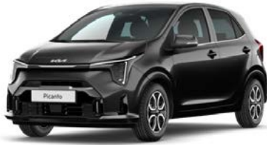
Auroraschwarz Met. (ABP)