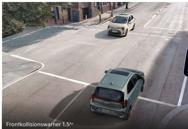
Frontkollisionsswarner 1.5 A+

Der serienmäßige Müdigkeitswarner (Driver Attention Warning, DAW) analysiert ständig verschiedene Fahrzeugparameter wie die Betätigung von Lenkrad und Blinker, die Beschleunigungsmuster und die Gesamtdauer der Fahrzeit. Erkennt das System bei dir Zeichen von Erschöpfung, weist es dich durch einen Warnton und eine Anzeige in der Instrumenteneinheit darauf hin (ohne Abbildung).