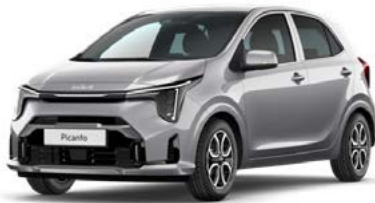
Sparklingsilber Met. (KCS)