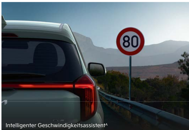
Intelligenter Geschwindigkeitsassistent A

Mit seinem deutlich erweiterten Angebot an modernen Fahrerassistenzsystemen leistet dir der Kia Picanto in kritischen Situationen tatkräftige Unterstützung.