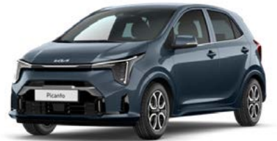
Smoke Blau Met. (EU3)