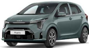
Adventure Grün Met. (A2G)