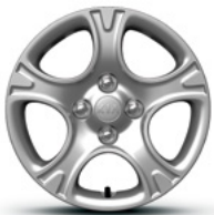
14-Zoll-Stahlfelgen mit Radabdeckung (Edition 7)